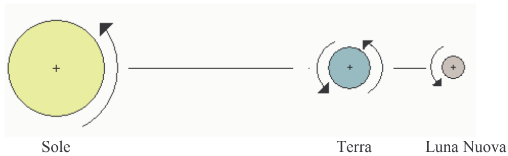
Grafico di O.G. di Luna Nuova